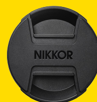
TAPPO OBIETTIVO LC-95B