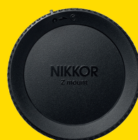
COPRIOBIETTIVO POSTERIORE LF-N1